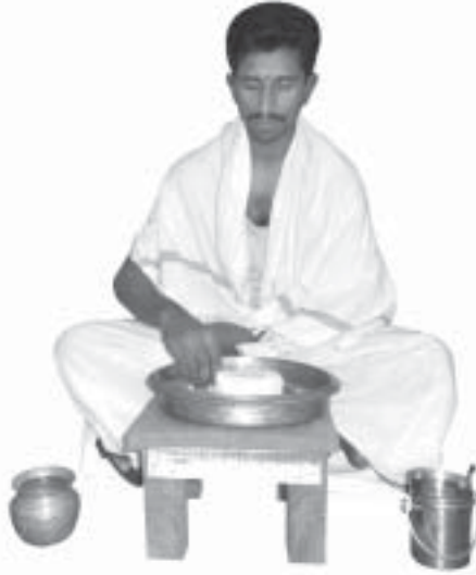
కంచు పాత్ర, రాగి చెంబు, ఆవు వెయ్యి, ఎక్కు పీట అో సుఖాసనంలా భోజనం చేయుట