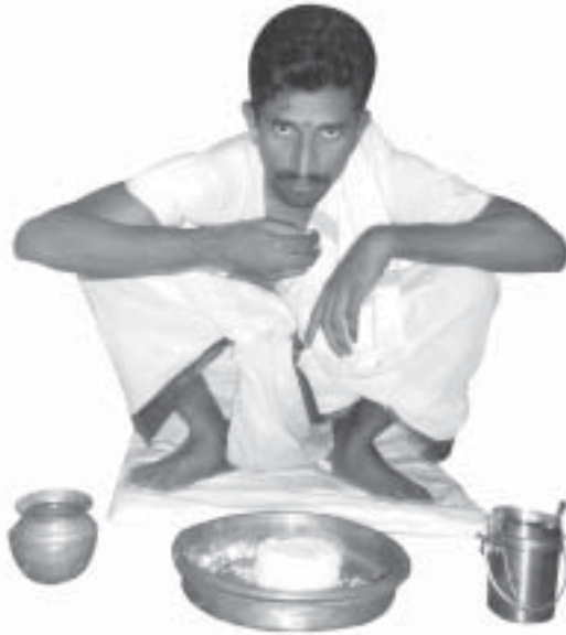
గాంతుక్ క్రూర్పుని భోజనం చేయుట