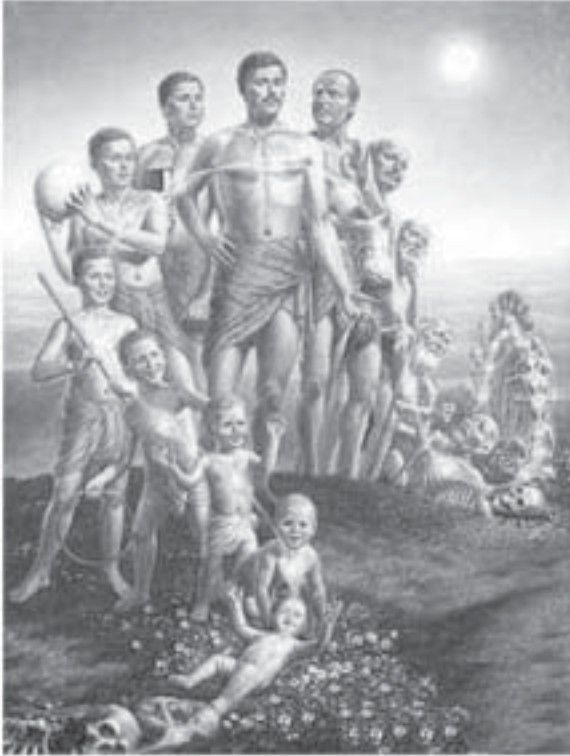
అన్ని వయస్సుల వారి త్రిదోషాలు

వాగ్గుటులు చెప్పే మరో ముఖ్యవస్తువు దాల్చిన చెక్క, వాయువు యొక్క ప్రకోపాలు ఎన్నివున్నాయో ఉదాహరణకు, ఉబ్బసం, ఆస్తమా, ఇవి వాయువు యొక్క అంటే వాత సంబంధరోగాలు. వీటిని నివారించటానికి ఎంతగానో ఉపకరిస్తుంది దాల్చినచెక్క. కఫ సంబంధ వ్యాధులను కూడా నయంచేస్తుంది. అంటే దగ్గు, జలుబు, స్థూలకాయము వంటి కఫ సంబంధ వ్యాధులను కూడా నయం చేస్తుంది. కాబట్టి దాల్చిన చెక్క కూడా ఉపయోగించుకోండి. అయితే దాల్చిన చెక్కని పౌడర్ గా చేసి వాడుకుంటే ఎక్కువ ఉపయోగం. ఇంకా బెల్లంతో కలిపి నూరుకుని తీసుకుంటే ఎంతో మంచిది. అలాగే తేనెతో కలిపి మర్దనం చేసివాడుకుంటే కనీసం 50 రకాలరోగాలు నయం చేసుకోవచ్చును. ఇలా మన వంటింట్లో ఎన్నో రకాల ఔషధాలు ఉన్నాయి.